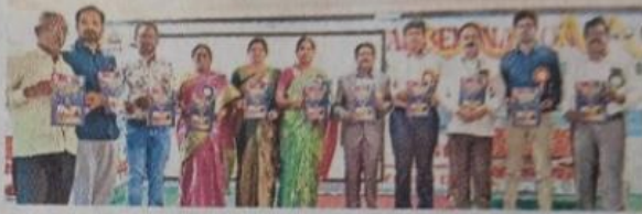
వత్రాలు ప్రదర్శిస్తున్న ప్రధానాచార్యురాలు, అధ్యాపకులు