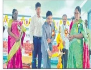
జాతీయ సదస్సులో జ్యోతి ప్రజ్వలన